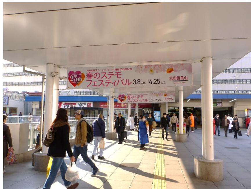
■掲出イメージ(柏駅へ向かうロケーション)