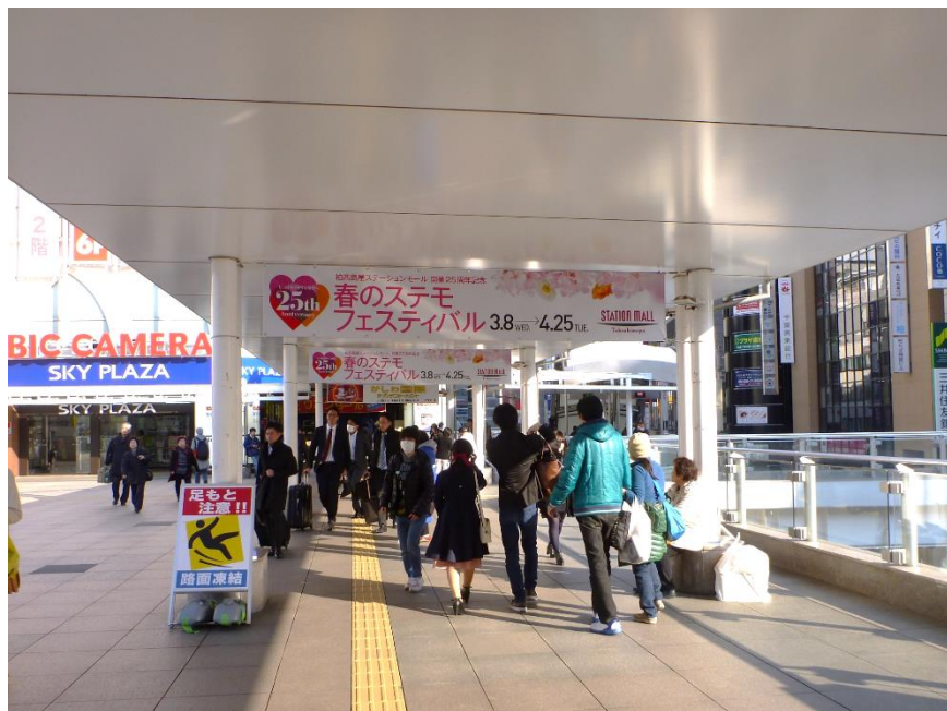
■掲出イメージ(柏駅側からのロケーション)

■行政枠の場合：1ヶ月掲出料金 ¥200,000-(税別、50%割引)といたします。