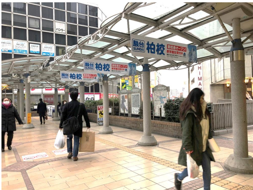
■ご掲出イメージ(柏駅からのロケーション)