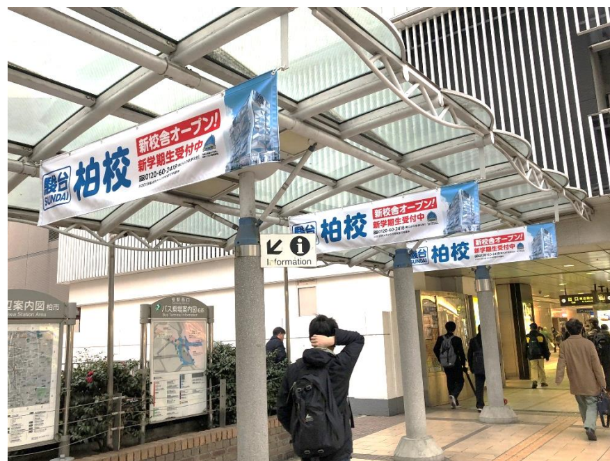
■ご掲出イメージ(柏駅へ向かうロケーション)