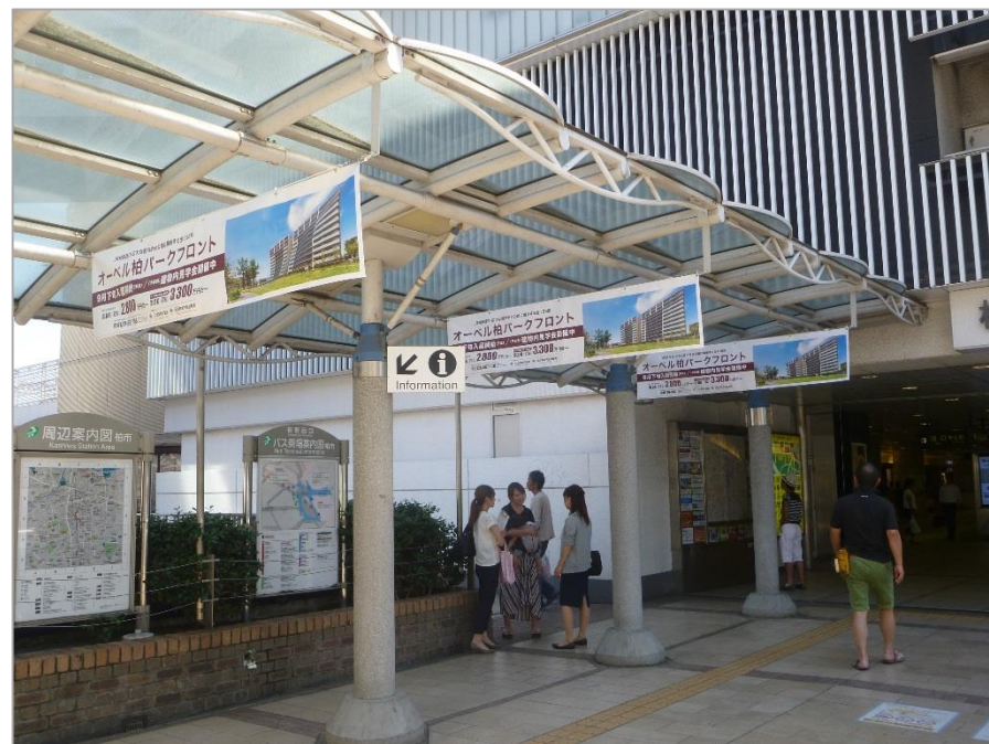
■ご掲出イメージ(柏駅へ向かうロケーション)