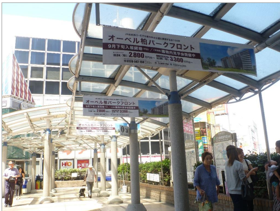
■ご掲出イメージ(柏駅からのロケーション)